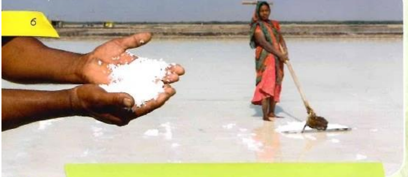
Випарювання солі в Індії.

Слово «гроші» походить від німецького «гроше», а те, у свою чергу, від латинського «гросус денаріус» — «великий денарій»); так упродовж восьми століть називалися монети кількох європейських країн. У княжій Русі-Україні головною грошовою одиницею була гривна — зливок срібла. Гривна дорівнювала 20 ногатам, 25 кунам (шкуркам куниці), 50 різанам (дрібним обрізкам гривни) або 150 векшам (шкуркам вивірки). За Середньовіччя та в Новий час в Україні використовувалися європейські монети — цехіни, дукати, талери. Карбувалася й місцева монета — наприклад, львівські «квартники» XIV ст. з латинським написом «монета руська».