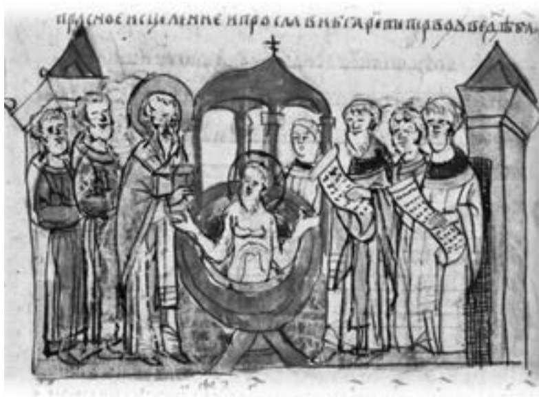
Хрещення Володимира Святославовича. Мініатюра з Радзивілівського літопису

вині IX ст. відбувається становлення державності у сербів, хорватів, словенців. У IX ст. утворюється Давньоруська державність з центрами у Києві, Старій Ладозі, Новгороді — Русь , якій пізніше учені дають назву Київська Русь. Київська Русь була однією з найбільших, наймогутніших і найвпливовіших держав середньовічної Європи. З'являються міста, розвиваються ремесла, йде активна торгівля і обмін товарами з арабськими країнами та Візантією. Військові вправи та походи слов'янських князів переважно закінчуються вдало. Захід та Схід можуть мати взаємини між собою тільки через територію Київ-