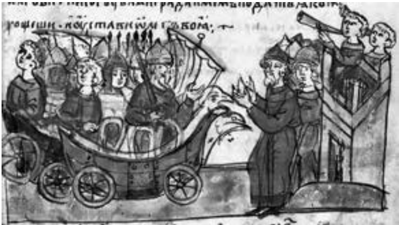
Похід князя Олега на Царгород. Мініатюра з Радзивіллівського літопису

Поява державності у слов'ян належить до VII—IX ст. Болгарська держава (перше Болгарське царство) заснувалася у 681 р. Хоч у кінці X ст. Болгарія підпала під залежність Візантії, як показав подальший розвиток, болгарська народність до того часу вже мала сталу самосвідомість. У другій половині VIII — першій поло-