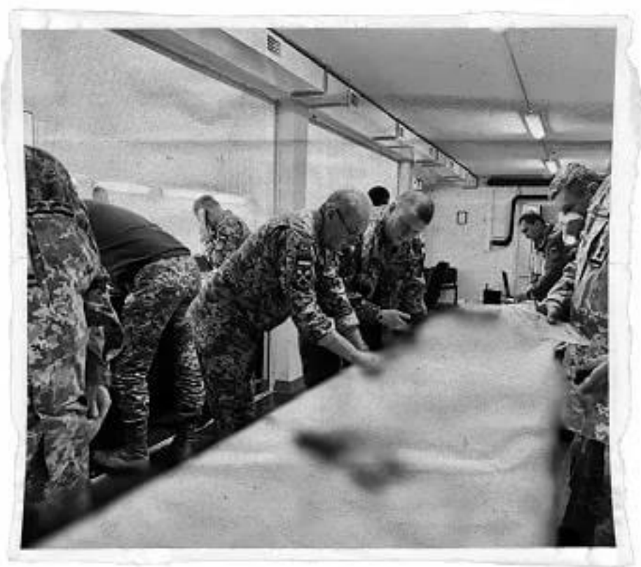
Віктор Муженко і Валерій Залужний, пункт управління військами.